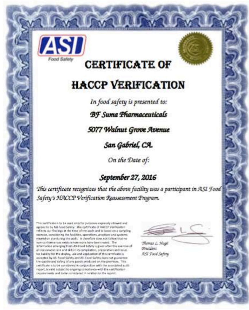
全球生產研發基地 HACCP證明