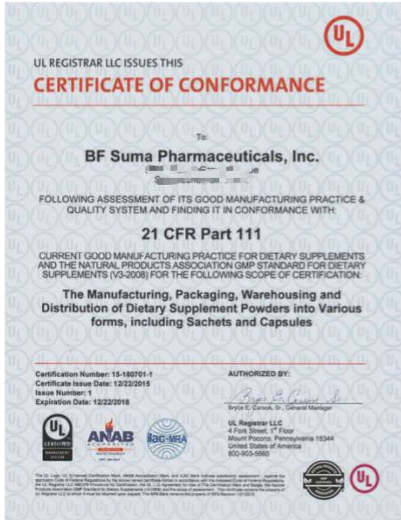
全球生產研發基地 GMP證明